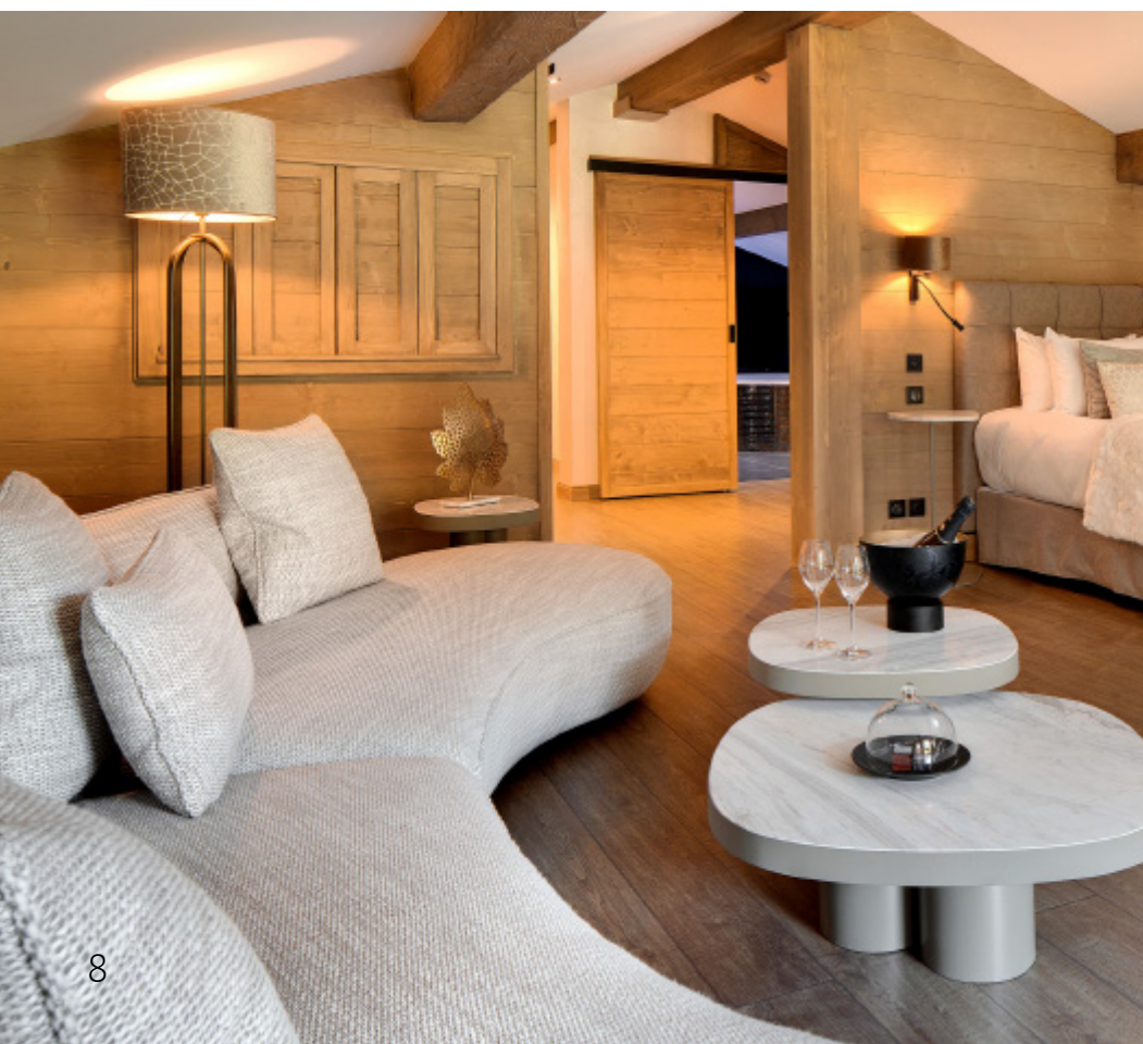
Top Suite Panoramique Joseph

Parmi ces havres de paix, la Top Suite Panoramique exclusive Joseph se distingue par son raffinement. Nichée au sommet du chalet, cette suite de plus de 80 m 2 offre un lit King Size, un salon design baigné de lumière, une table à manger pour des dîners gourmets, et une somptueuse salle de bain en onyx avec baignoire balnéo ronde et télévision intégrée. Un dressing, un coin bureau et une petite cabane avec deux lits simples pour les enfants complètent cet écrin de luxe.