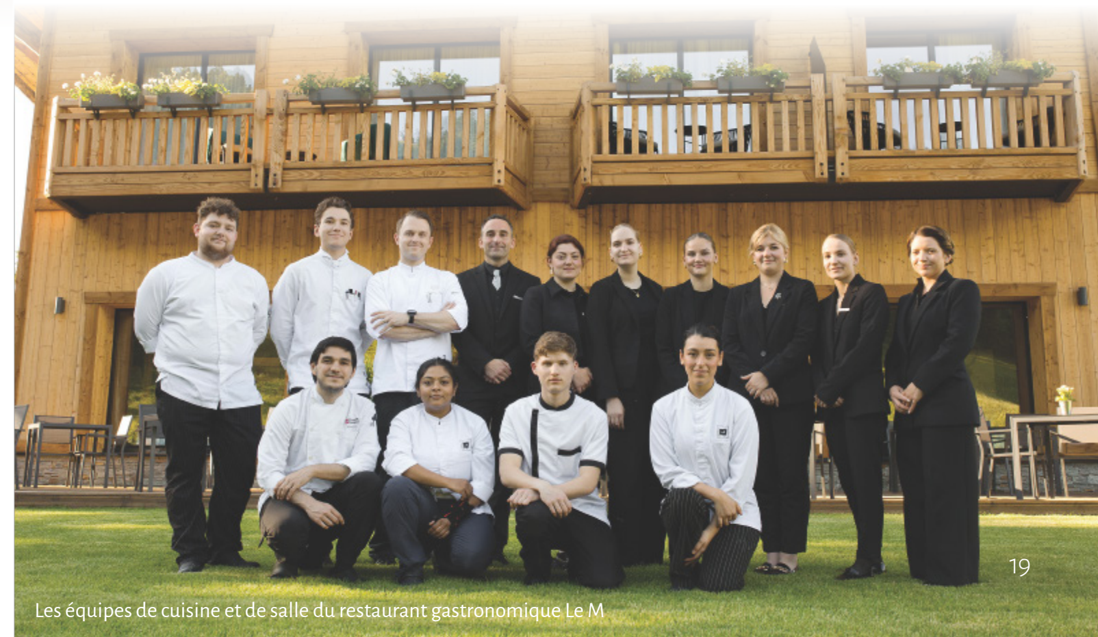
Les équipes de cuisine et de salle du restaurant gastronomique Le K