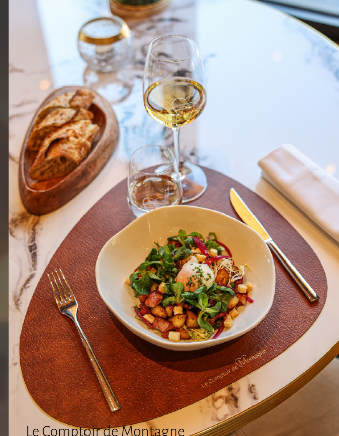
Le Comptoir de Montagne